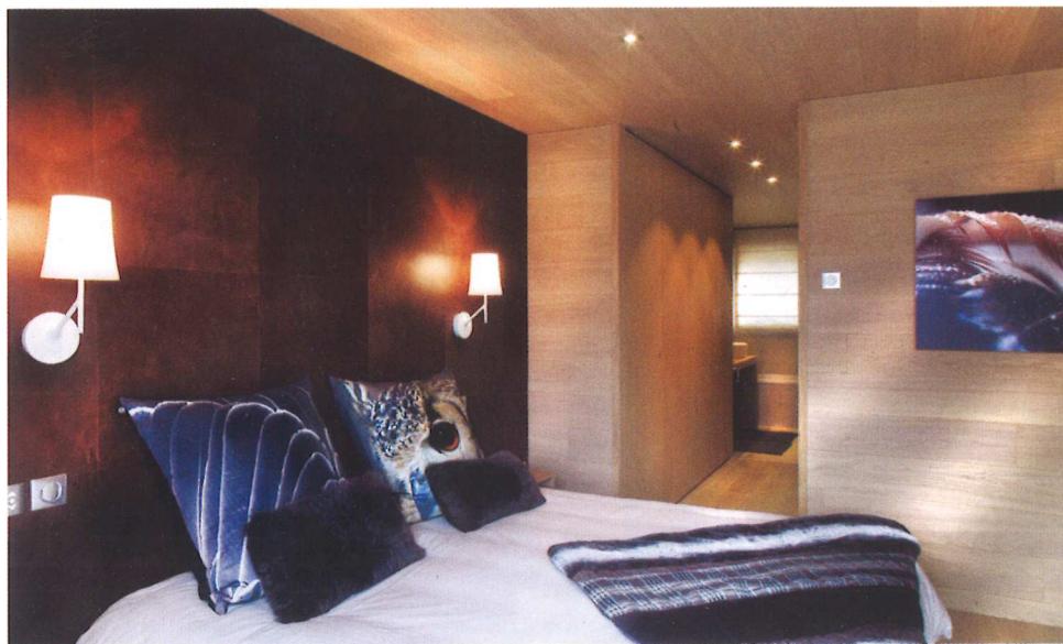
Dans la chambre master, la tête de lit est composé de panneaux bois recouverts de cuir (STP Wood Flooring).