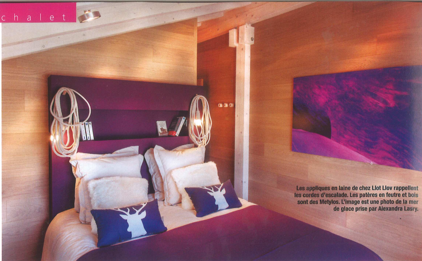
Les appliques en laine de chez Llot Llov rappellent les cordes d'escalade. Les patères en feutre et bois sont des Metylos. L'image est une photo de la mer de glace prise par Alexandra Lasry.