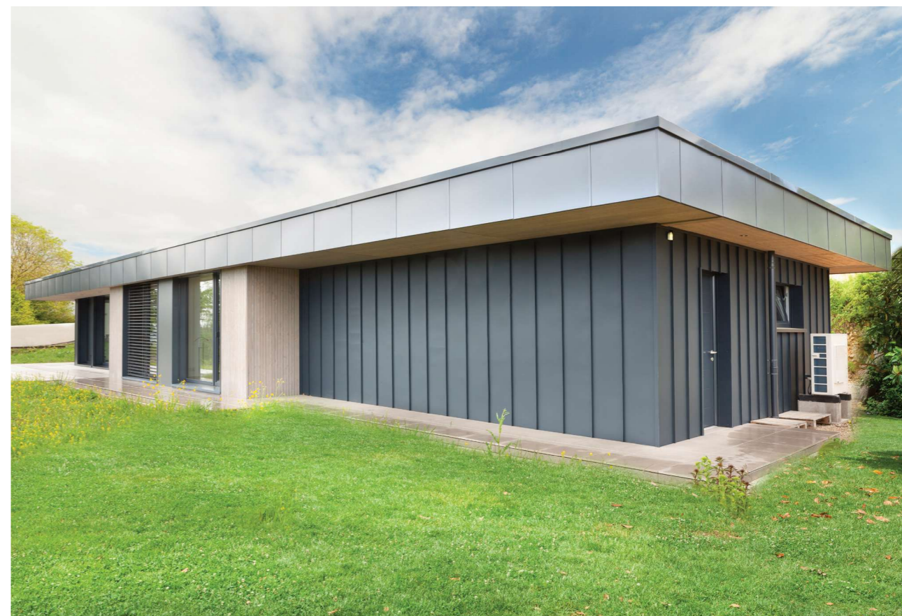
Ci-dessus : La maison combine ossature bois, triple vitrage et plancher chauffant / rafraîchissant. Un concentré de confort basse consommation adapté aux hivers rigoureux du Haut-Doubs.