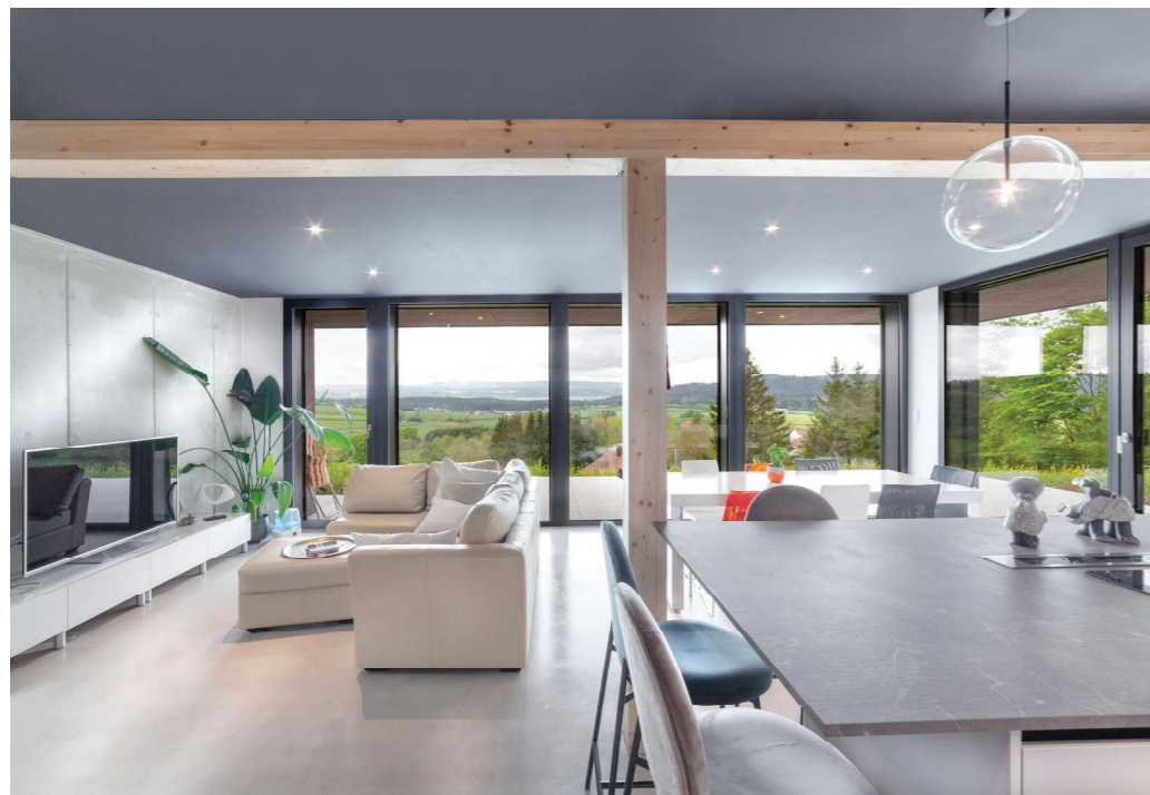
Ci-dessus : Au cœur de la maison, le séjour de plain-pied s'ouvre largement sur la terrasse. Les grandes baies vitrées cadrent la vue et prolongent le sol en béton ciré vers l'extérieur.